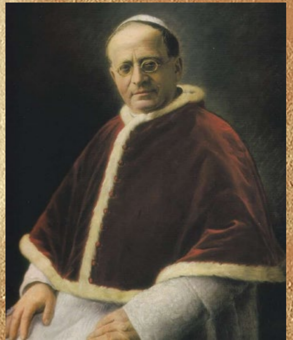
XI. PIUS PÁPA portréja

(Forrás: Gál Ferenc: XI. Pius pápa teológiája, Kassa, 1941.)