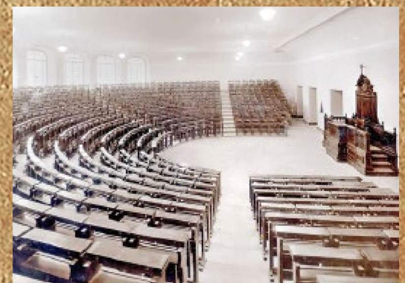
Az egyetem egyik előadóterme