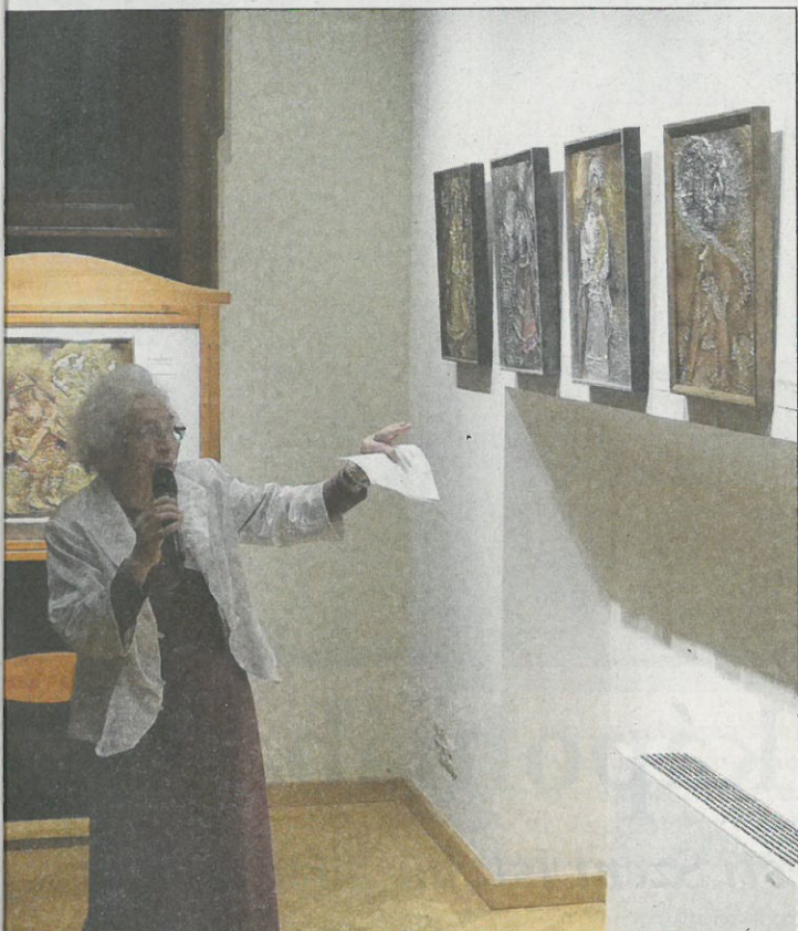
Mik a tervei, soron következő munkái?

szoborral foglalkoznak. E Madonna-szobor nem a Mátyás-templom számára készült, vétel útján került a gyűjteménybe. Kutatásom eredménye, hogy közvetlenül kapcsolódik a XV. századi európai gótika német területen született, korszakváltást jelentő fő művéhez, az 1443. évi freisingi főoltárhoz. Ennek szekrényoszobrai ma a müncheni galériában láthatók. Mesterük nem más, mint Kassai Jakab , a Bécsben élő, európai hírű szobrász. A Budavári Madonna e későbbi oltárszobrainak egyik előzménye lehet az 1430–1440-es évekből. Az alkotás múltjának tisztázása jelenleg a legizgalmasabb feladatomban.